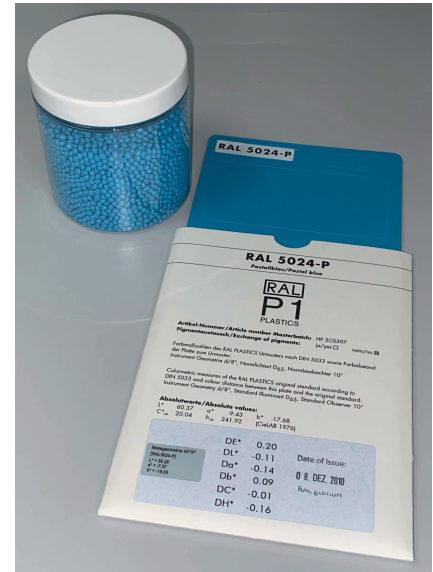
Bild 2. Als Referenz für die Analysen dienen RAL-Farbkarten.

In der Softwareoberfläche Docu werden die letzten 100 Messungen angezeigt sowie die Abweichungen in L^* , a^* und b^* zur eingegebenen Referenz. Die Messdaten können in einer Datei abgespeichert werden. Diese lässt